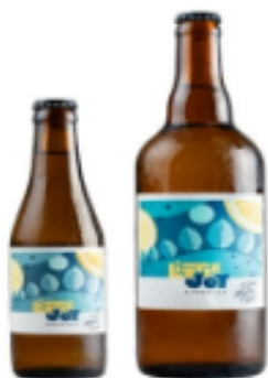
CITRON - MENTHE - TIMUT

Little Joy Kombucha , c'est la pétillance bretonne version bien-être. Installée à Vannes, cette jeune marque artisanale brasse des kombuchas bio aux saveurs originales et rafraîchissantes. Une boisson vivante, naturellement fermentée, riche en probiotiques, sans sucres ajoutés . Little Joy , c'est le plaisir de se faire du bien, à la bretonne.